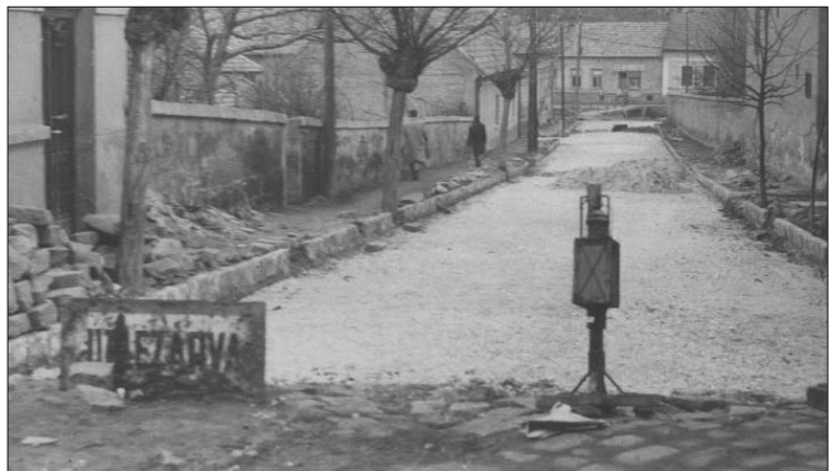
Nehéz időszakra számíthatnak a pismányiak, a sok szükséges útelterelés, elterelés miatt.

Ebben a klubban a város pályázatai sikeresek voltak. Így állami forrásból 710 millió forint fordítható a Barcsy iskola bővítésére és felújítására, több tíz millió forint jutott informatikai fejlesztésre, majd 300 millió forint Uniós pénzből épül majd a városban 2000 méter gát és rajta kerékpárút. A kistérség 13 települése szintén EU-s forrásból hajthat végre 540 millió forintos informatikai fejlesztést, melyhez mintegy 460 milliót közösségi forrásból, 42 milliót a Belügyminisztérium (a továbbiakban BM) „önerős” és 5 milliót a BM kistérségi pályázatából nyertünk. Pályázati pénz segített eszközbeszerzéseket, kátyúzást, belsőellenőrzést, hulladékgazdálkodási tervet, zajterképet és sok más beruházást megvalósítani. Az első két elbírálási fordulón szintén támogató ajánlással jutott túl a bölcsőde felújítását, bővítését tartalmazó Uniós pályázatunk. S végre a képviselőtestület jobboldali többsége is belátta, hogy tervezésre forrásokat kell biztosítani, mert csak kész tervekkel lehet pályázni.